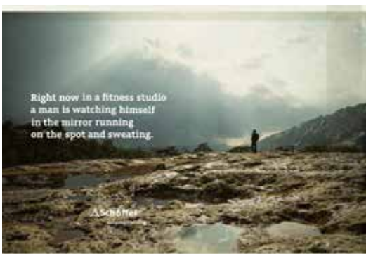
Agentur: Ogilvy & Mather Germany. Foto: Uli Wiesmeier

7 https://www.youtube.com/watch?v=Xc2Oxq0DaAQ